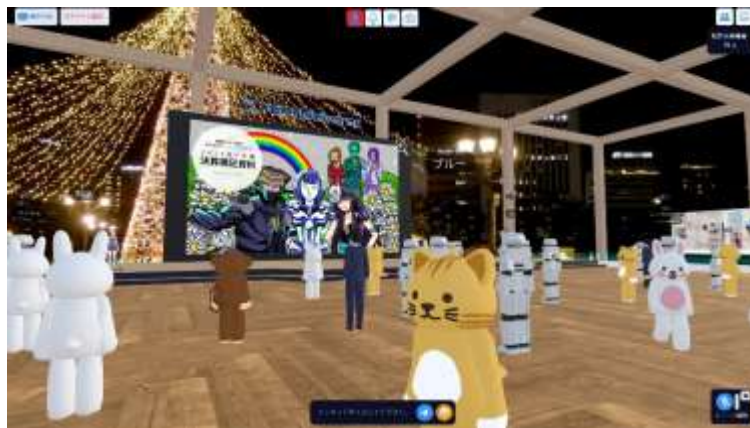
会場となる企業向けメタバース（画像は前回開催時の様子）

当社は、2026 年 2 月 12 日（木）17 時 00 分より 18 時 00 分までの 1 時間、2026 年 9 月期第 1 四半期の決算説明会をメタバースにて開催することとしましたので、お知らせいたします。