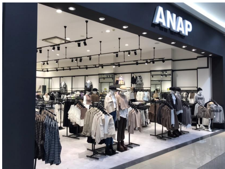
ANAP 社 実店舗

企業独自の専用メタバース空間を構築するメタバース開発サービスです。講演会などのバーチャルイベント、バーチャルオフィスなど企業活動の様々なシーンに対応可能なバーチャル空間を構築し、企業が来訪者に向けて各種のサービスを提供できるようサポートします。