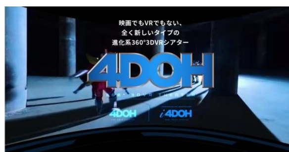
4DOH ホームページ https://4doh.info