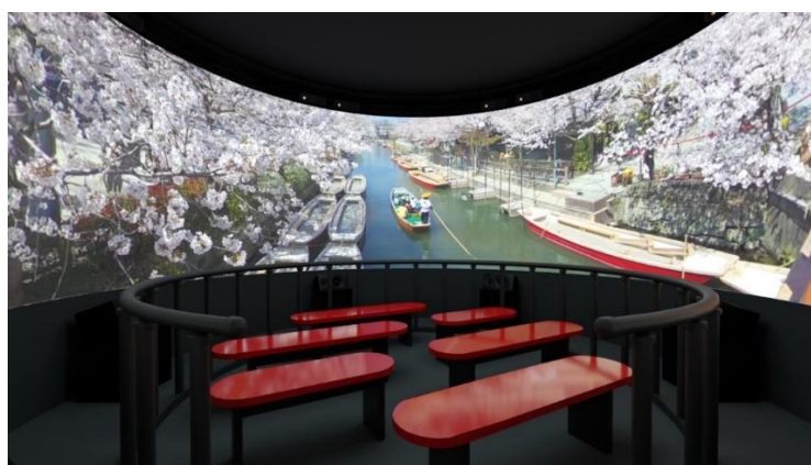
当社製品 4 DOH

ANAP 社のもつ店舗設計ノウハウ、ファッション性の高いディスプレイノウハウと、Meta connect by ANAP (※1) を利用したメタバース向けアイテム生成技術に、当社の感動共有型 VR シアター「4DOH (※2)」の「実写 (360° VR) + CG」による、映像コンテンツの作成、上映も可能なデジタル映像生成テクノロジーを応用し、企業に適した専用メタバース空間を構築いたします。