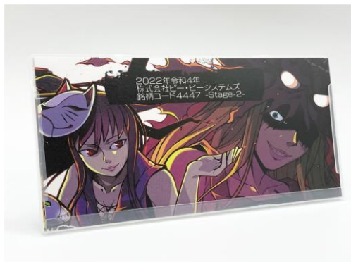
特製カレンダーの参考イメージ (デザインは描き下ろしイラストに変更予定)

Stage-1 から Stage-10 まで毎年継続する計画で、今年の優待品特製カレンダーは Stage-3 です。一昨年の優待品特製カレンダー Stage-1 と昨年の優待品特製カレンダー Stage-2 の続きとなります。カレンダーの表紙を 10 年間、毎年縦横に並べてつなげていくと一枚の絵が完成し、何かが見えてくる！という仕掛けデザインです。